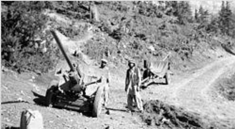
Афганські моджахеди з двома гарматами. 1984