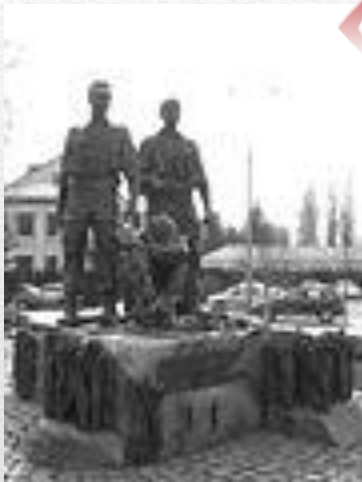
Пам'ятник воїнам - « афганцям » у Києві