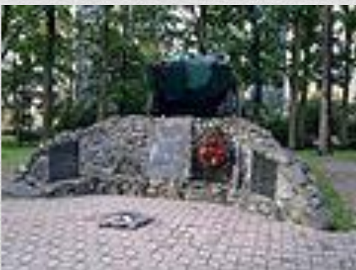
Пам'ятник воїнам- «афганцям» у Бучі