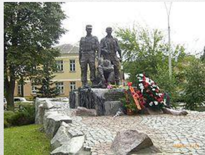
Меморіальний комплекс пам'яті воїнів України, полеглих в Афганістані, Київ