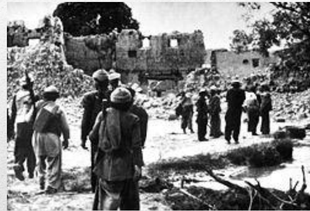
Селище моджахедів, зруйноване радянськими військами (1986)