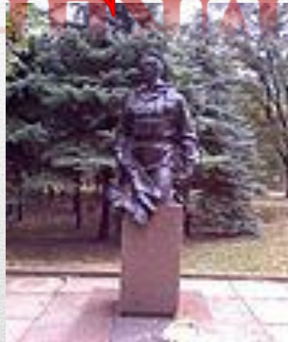
Пам'ятник воїнам - « афганцям » у Кривому Розі