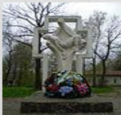
Пам'ятник воїнам, котрі загинули в Афганістані, у Дрогобичі